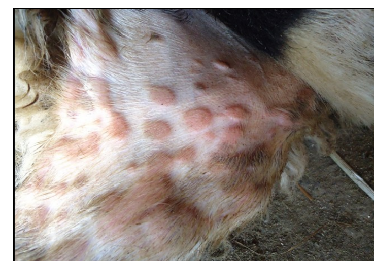
Τυπικές αλλοιώσεις ευλογιάς. Κόκκινα σπυριά (βλατίδες).