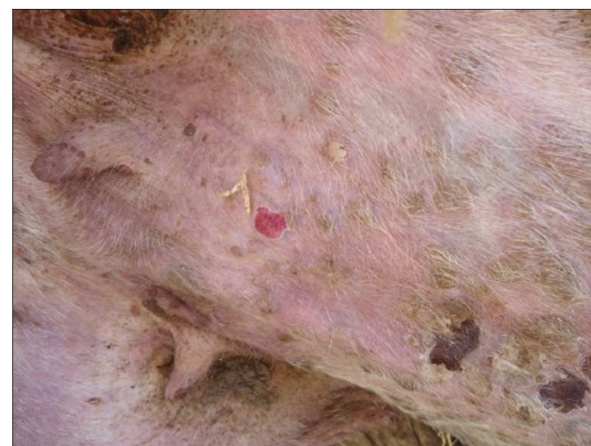
Προχωρημένες αλλοιώσεις ευλογιάς. Μαύρα κάπαλα (εφελκίδες) και πληγές (έλκη) στο ίδιο ζώο.