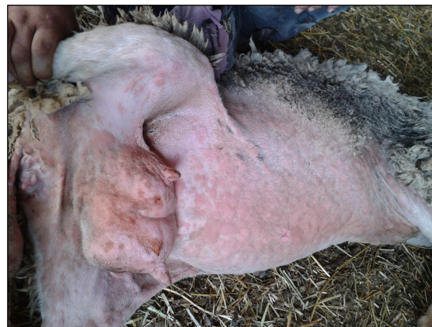
Εκτεταμένες αλλοιώσεις ευλογιάς σε όλη την κοιλιά, στους μαστούς, τους μηρούς, τα γεννητικά όργανα και τη βάση της ουράς. Κοκκινίλες (κηλίδες) και κόκκινα σπυριά (βλατίδες).