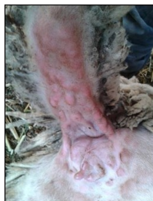
Χαρακτηριστικές αλλοιώσεις ευλογιάς στη βάση της ουράς. Κόκκινα σπυριά (βλατίδες).