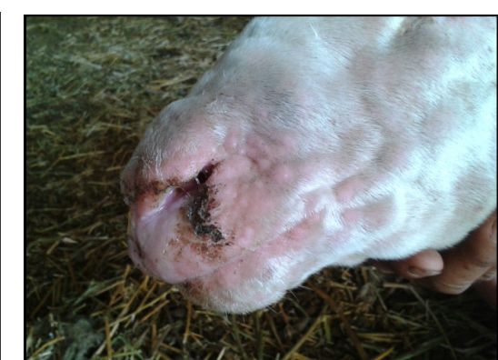
Πρόβατο με αλλοιώσεις ευλογιάς στο πρόσωπο. Κοκκινίλες (κηλίδες), κόκκινα σπυριά (βλατίδες) και μύξες (ρινικό έκκριμα).