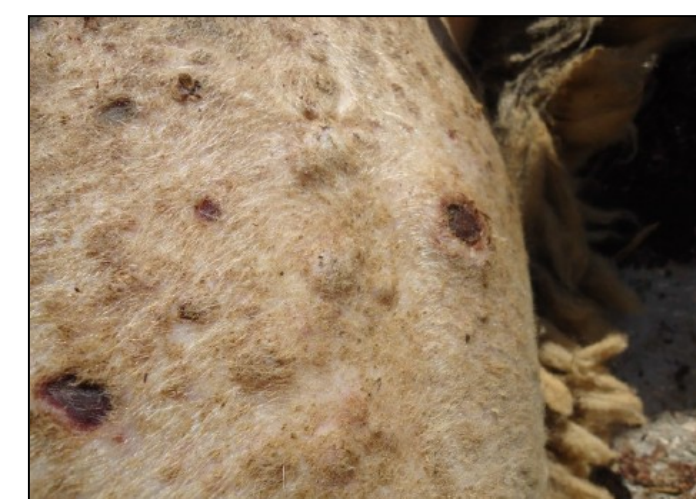
Προχωρημένες αλλοιώσεις ευλογιάς. Μαύρα κάπαλα (εφελκίδες).