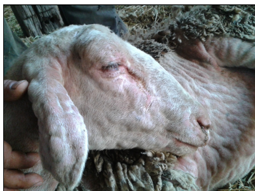
Πρόβατο με εκτεταμένες αλλοιώσεις ευλογιάς στο κεφάλι, το πρόσωπο και την κοιλιά. Κόκκινα σπυριά (βλατίδες).

2 Ψάχνουμε προσεκτικά για : Κοκκινίλες, Κόκκινα Σπυριά, Μαύρα κάπαλα, Πληγές, Μύξες, Δάκρυα